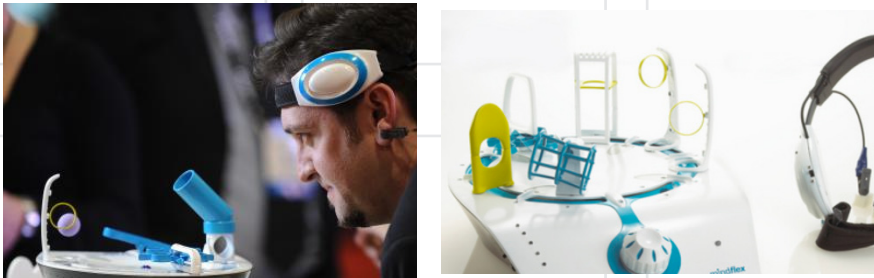
Figura 2. Mindflex. Juego de Mattel que se controla por ondas cerebrales, y que consiste en que el usuario levante y mueva una pelota dentro de un circuito de obstáculos, sólo y exclusivamente con el poder de su mente. La concentración es la clave: cuando se pierde, la bola cae y el jugador pierde. Para controlar la bola solo hay que ajustarse unos auriculares dotados de sensores. Gracias a la tecnología EEG, es posible leer el estado de concentración de cada jugador. En: http://mindflexgames.com/how_does_it_work.php