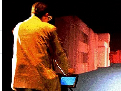
Figura 1. Legible City, obra de Jeffrey Shaw. En "Legible City" el visitante tiene la posibilidad de montar una bicicleta estática y recorrer una ciudad construida por grandes letras tridimensionales generadas en un sistema computacional que forman palabras y oraciones a lado y lado de la calle. En: http://www.jeffrey-shaw.net/html_main/frameset-works.php3

Como resultado de todo lo anterior, y con miras a esclarecer cómo ha evolucionado el diseño de pantalla a el diseño de espacios mediatizados, en el proyecto de investigación se estudiaron y aplicaron las nuevas formas de comprensión de los espacios, el sonido y la imagen, basadas en la materialidad