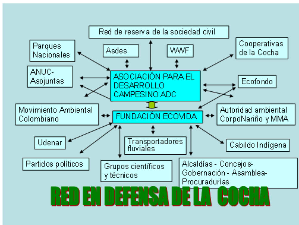
Figura 13. Red del movimiento en defensa del Lago de la Cocha

Con este triunfo de decretar a la Cocha humedal Ramsar, las diferentes organizaciones de la red continúan su “política de influencia” con más argumentos, ejerciendo persuasión y presión sobre diferentes partidos políticos, instituciones gubernamentales locales, regionales y del orden nacional especialmente del Ministerio del Medio Ambiente pregonando la inconveniencia de la licencia ambiental al PMG.