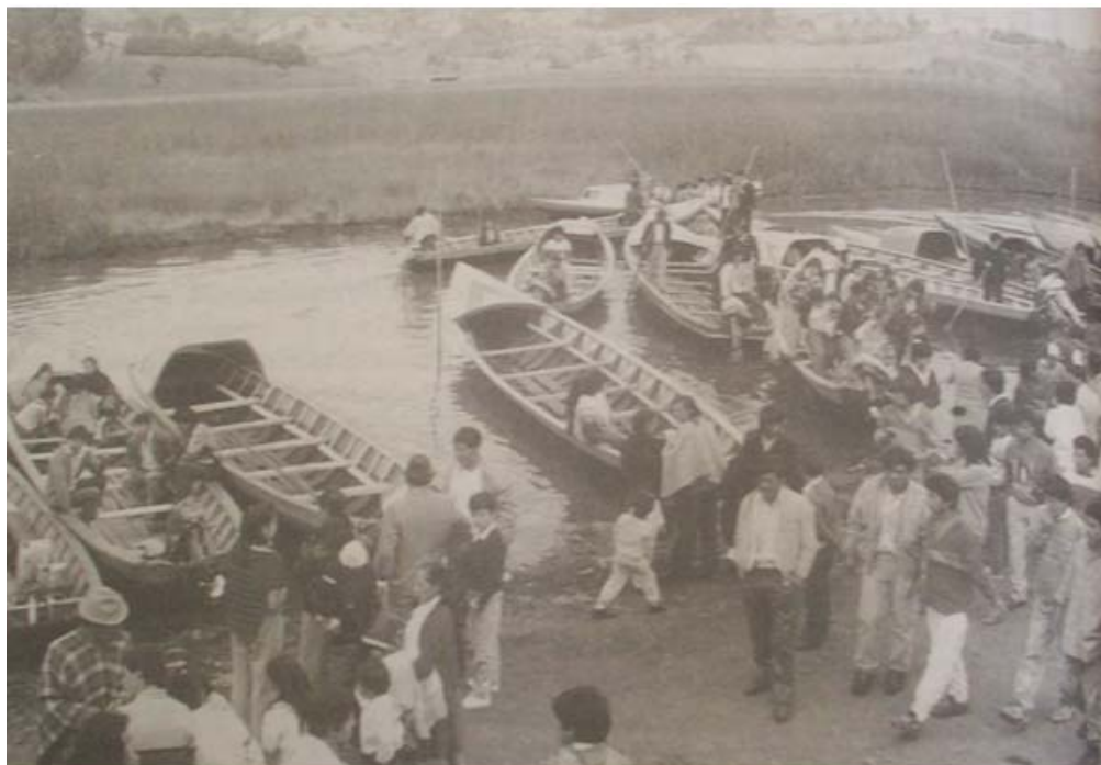
Figura 12. El Puerto, corregimiento del Encano (Pasto). ( Diario del Sur , Pasto, 22 de abril de 1998, p. 6a).

El movimiento ambientalista local extendió sus redes a los transportadores fluviales, al recientemente fundado Cabildo Indígena del corregimiento del Encano, a las procuradurías regionales quienes también se pronunciaron ante el MMA.