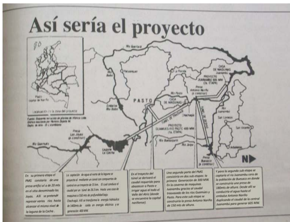
Figura 1. Etapas del Proyecto Multipropósito Guamués –PMG–. ( Diario del Sur , Pasto, 19 de junio de 1996, p. 3b).