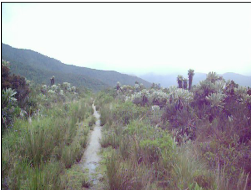
Figura 3. Los Páramos azonales (vereda Santa Isabel, corregimiento del Encano, Pasto) ecosistema defendido por los movilizados. (Tarazona, 2008).

No obstante, la causa fundamental es que las cooperativas obtuvieron influencia directa de la red del movimiento ambiental nacional en construcción en cuanto a organización ambiental: