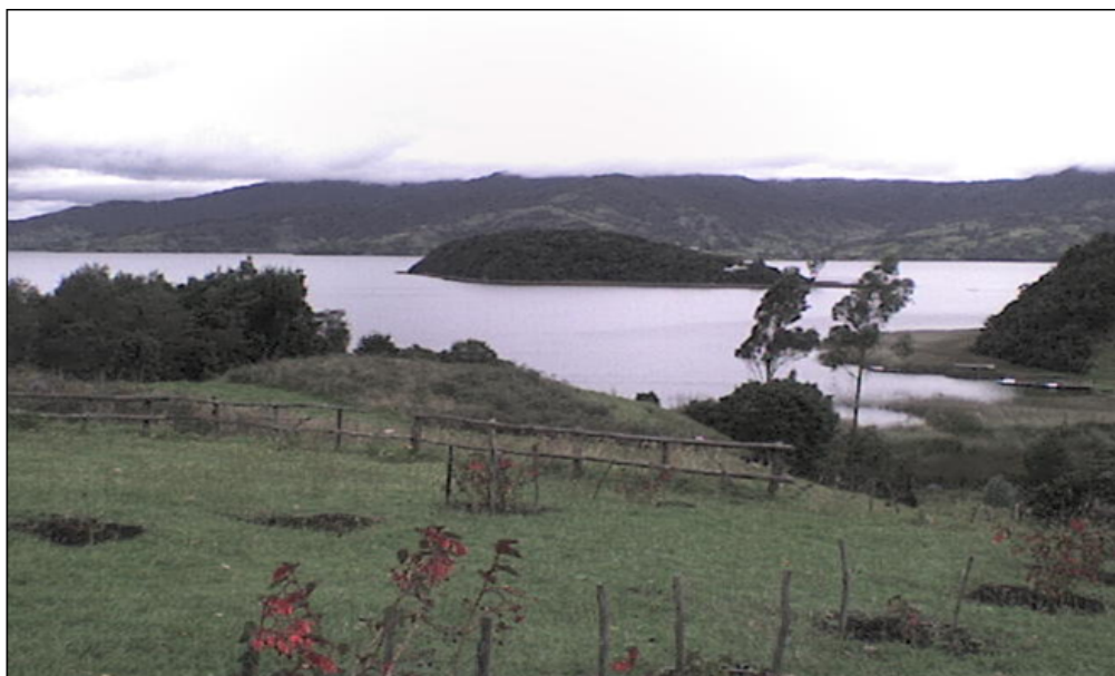
Figura 11. Laguna de la Cocha - Santuario de Flora y Fauna Isla La Corota.

La Carencia y equilibrio y equidad en el tratamiento y sustentación del auto; la realización de una interpretación del convenio RAMSAR, parcializada y llena de inconsistencias; sustentar la negativa en afirmaciones erróneas y equivocadas. Referentes al manejo del embalse y su posible impacto negativo sobre el Santuario de Flora y Fauna de la Corota. (Auto No. 467 del 9 de mayo de 1992 del MMA, p. 3)