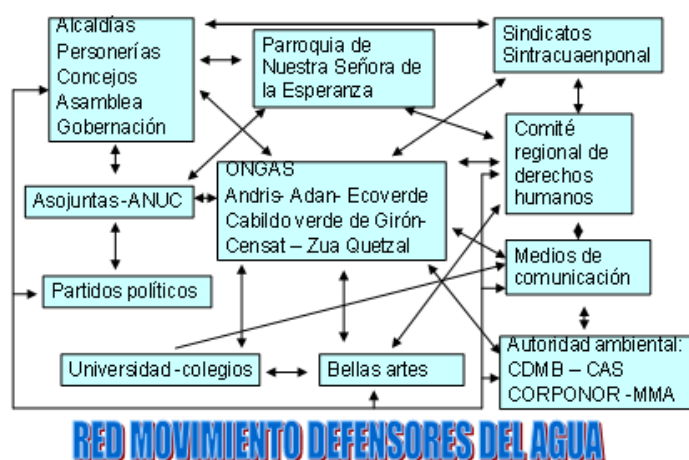
Figura 11. Red del Movimiento en Defensa del Agua de Piedecuesta y municipios vecinos.

En el año 2003 la ciudad de Bucaramanga no sufrió racionamientos de agua, según alarma establecida en los medios de comunicación por la CAMB y el gremio constructor con el interés de generar una opinión favorable en la búsqueda de la licencia ambiental por parte de la CDMB. Sin embargo, en 2008-2009 se persistió en aplicar la misma estrategia, en los medios de comunicación, para obtener la aprobación del Proyecto Embalse de Bucaramanga 38 .