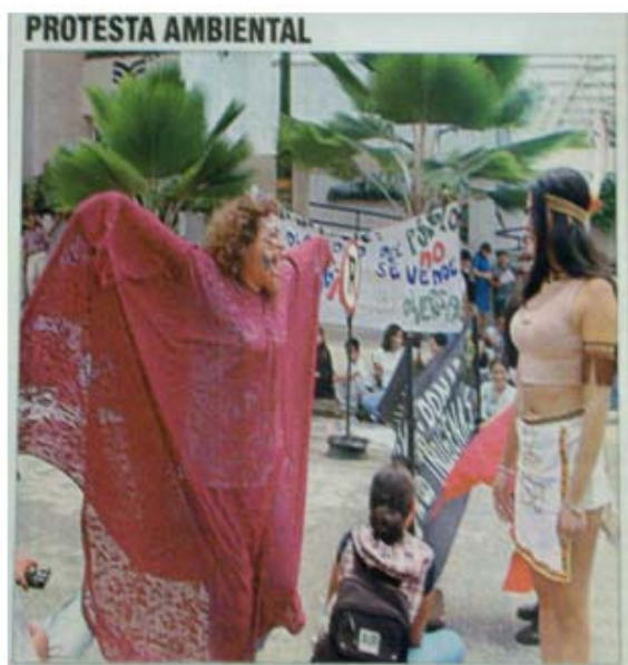
Figura 8. Registro en prensa local de movilización ambiental en contra del macroproyecto.

El Movimiento Defensores del Agua se caracterizó, particularmente en el inicio, transcurso y final de su contienda por enfrentar a sus contradictores a través de los medios de comunicación.