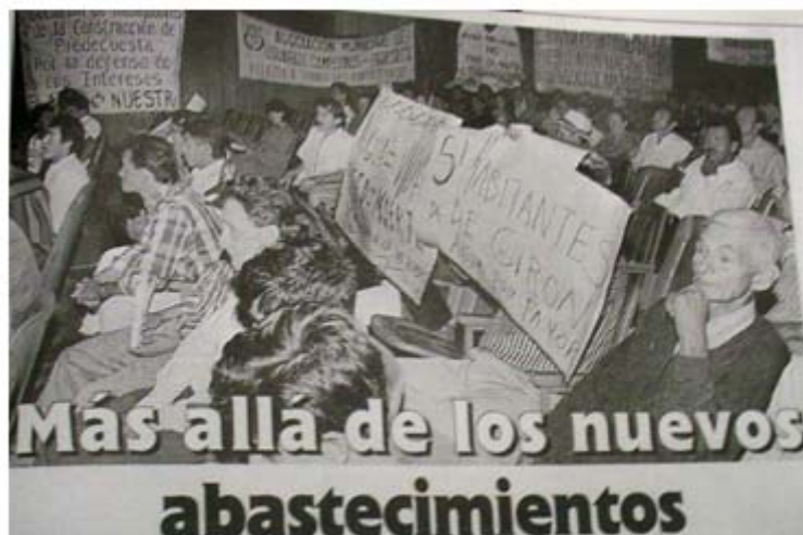
Figura 7. Última sesión de la Audiencia Pública Ambiental.

Lo que se evidencia con las arengas del sindicato 32 de la CAMB en la última fase de la APA y con las mesas de concertación posteriores a la Audiencia Pública Ambiental, al estilo de las reivindicaciones de los heredados en el movimiento obrero, así: