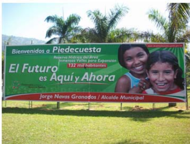
Figura 2. Valla que ilustra la polaridad a que se ve enfrentada la localidad de Piedecuesta, entre el cuidado de sus valles y el desarrollo urbanístico.

los pulmones verdes del AMB ya que albergan relictos del árbol de Caracolí.