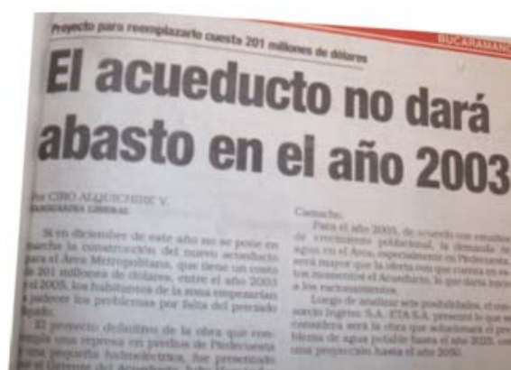
Figura 9. Campaña emprendida por la CAMB en los medios para presionar la construcción del megaproyecto.

Según la argumentación e información divulgada por las partes se tenía la sensación de que quien hacía la última entrega al medio de comunicación, dependiendo de su impacto, golpeaba a su enemigo e iba “triumfando” en la contienda.