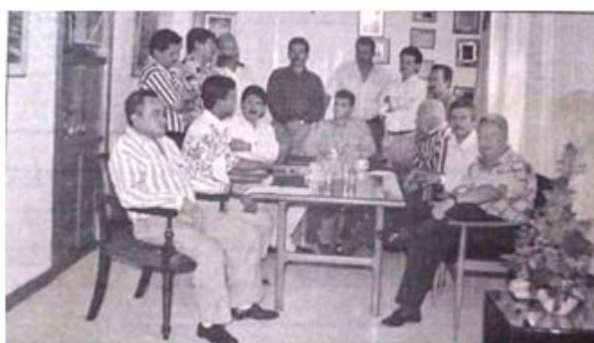
Figura 6. Integrantes del Concejo local de Piedecuesta.

Es entonces la conjugación del Movimiento de Defensores del Agua con la institucionalidad para hacer frente al macroproyecto, lo que prospecta la concreción de Convocar el 4 de agosto de 1997 al Cabildo Abierto (Ley 134 de 1994, tramitado por el Consejo Municipal), mecanismo de participación que estaba sin estrenar en muchos municipios colombianos (Gutiérrez, 1998) y que con la presión del Movimiento Defensores del Agua se hizo utilizar. En este espacio las comunidades exigieron la devolución de la administración del Acueducto local de Piedecuesta que estaba en manos de la CAMB desde 1990. A la vez, al sentir vulnerados sus derechos con el macroproyecto los participantes reaccionan y desde el saber natural campesino-popular se presentan argumentos a su favor que parecen increíbles al saber científico-técnico 20 . Pero, ¿cómo se expresa el saber popular?