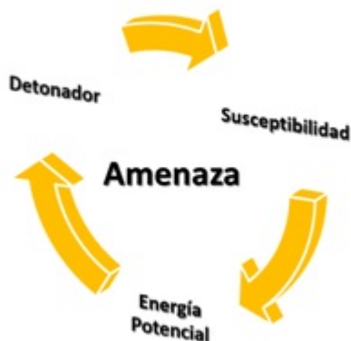
Figura 2. Componentes de la amenaza

Elaboración propia. Adaptado de Foschiatti (2012).