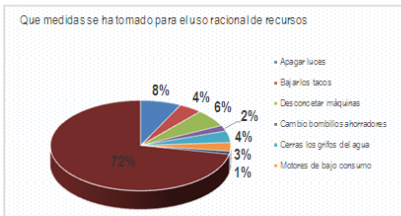
Figura 2. Medidas que utilizan las organizaciones pertenecientes al Clúster Textil Confecciones del Tolima